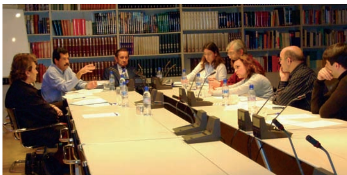
Uno de los grupos de trabajo constituidos, durante su primera reunión.

El segundo grupo, que se reunió el pasado día 15, es el denominado Grupo de Directivos Innovadores. En él participan directivos de diferentes centros públicos, privados y concertados de la Comunidad de Madrid, Valladolid y Valencia. Según se puso de manifiesto, la pre-