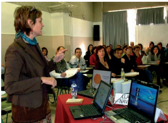
Una de las sesiones desarrolladas en el C.P. Azorín.

Una de las recomendaciones fue que los docentes no deben perderse en un 'activismo frenético', en la puesta en marcha de iniciativas puntuales. Es preferible integrar esas iniciativas en un proceso coherente, con una metodología sólida que asegure que el proceso es progresivo e impida las improvisaciones.