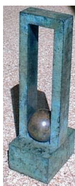
Galardón del certamen