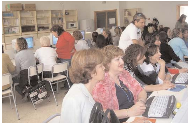
Docentes, en uno de los cursos del Foro de Experiencias Pedagógicas

Los alumnos utilizan unos medios tecnológicos en su vida diaria que no están bien incorporados en la escuela